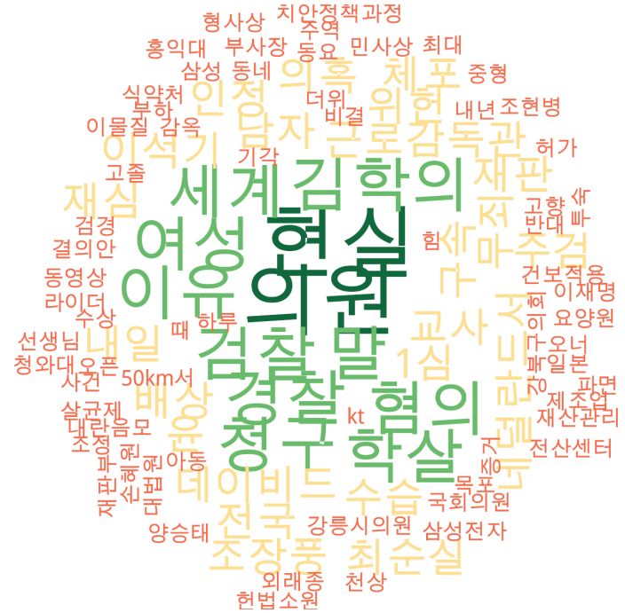
사회 분야 타이틀 단어 워드클라우드 | 경향, 오마이, 한겨레 사이트 첫 페이지에 걸린 사회 분야 뉴스의 워드 클라우드.