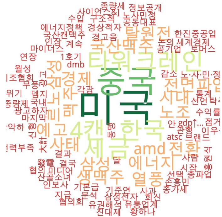
경제 분야 타이틀 단어 워드클라우드 | 동아, 중앙, 조선 사이트 첫 페이지에 걸린 경제 분야 뉴스의 워드 클라우드.