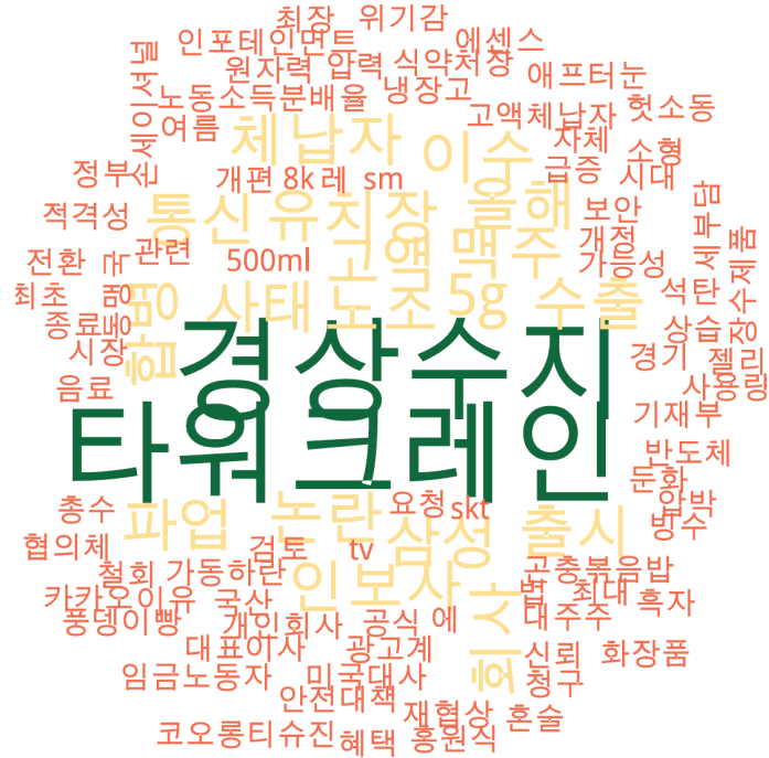
경제 분야 타이틀 단어 워드클라우드 | 경향, 오마이, 한겨레 사이트 첫 페이지에 걸린 경제 분야 뉴스의 워드 클라우드.