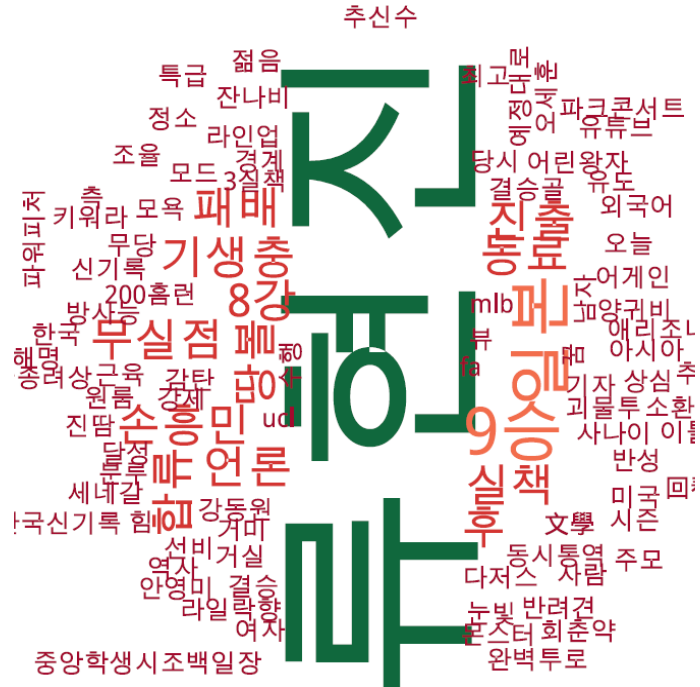
문화 분야 타이틀 단어 워드클라우드 | 동아, 중앙, 조선 사이트 첫 페이지에 걸린 문화 분야 뉴스의 워드 클라우드.