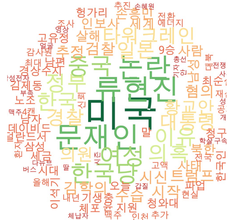
타이틀 단어 워드클라우드 | 경향, 동아, 오마이, 조선, 중앙, 한겨레 사이트 첫 페이지에 걸린 뉴스의 타이틀 워드 클라우드. (※ 지속적으로 모니터링 대상 언론사를 추가할 예정입니다.)