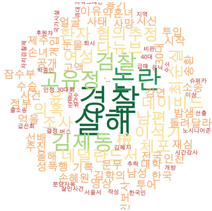
사회 분야 타이틀 단어 워드클라우드 | 동아, 중앙, 조선 사이트 첫 페이지에 걸린 사회 분야 뉴스의 워드 클라우드.