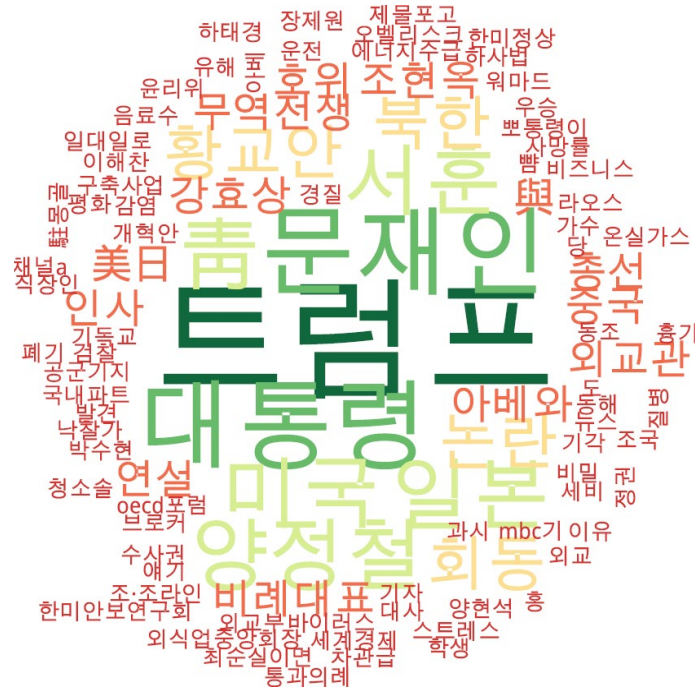
정치 분야 타이틀 단어 워드클라우드 | 동아, 중앙, 조선 사이트 첫 페이지에 걸린 정치 분야 뉴스의 워드클라우드.