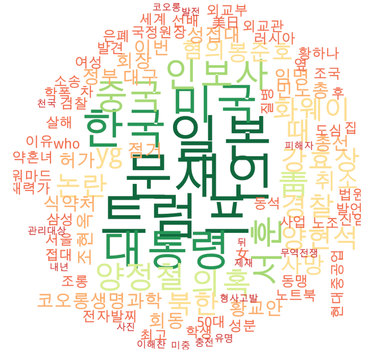
타이틀 단어 워드클라우드 | 동아, 조선, 중앙 사이트 첫 페이지에 걸린 뉴스의 워드 클라우드.