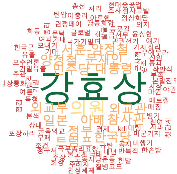
정치 분야 타이틀 단어 워드클라우드 | 경향, 오마이, 한겨레 사이트 첫 페이지에 걸린 정치 분야 뉴스의 워드 클라우드.