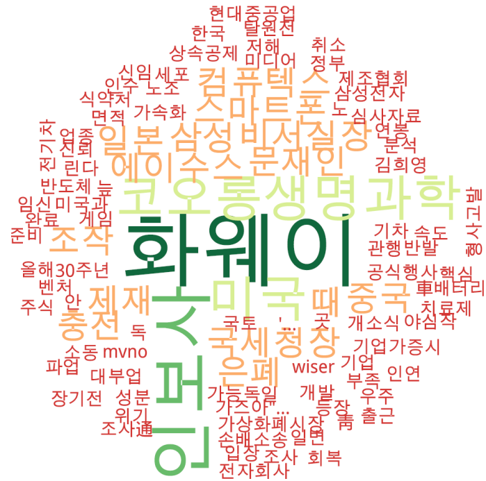
경제 분야 타이틀 단어 워드클라우드 | 동아, 중앙, 조선 사이트 첫 페이지에 걸린 경제 분야 뉴스의 워드 클라우드.