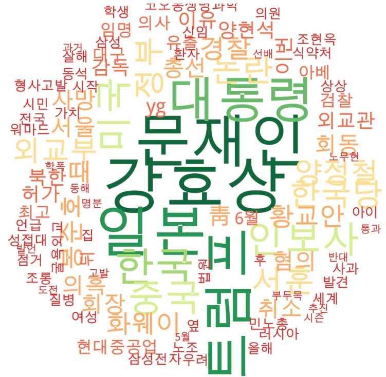
타이틀 단어 워드클라우드 | 경향, 동아, 오마이, 조선, 중앙, 한겨레 사이트 첫 페이지에 걸린 뉴스의 타이틀 워드 클라우드. (※ 지속적으로 모니터링 대상 언론사를 추가할 예정입니다.)