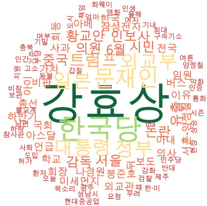
타이틀 단어 워드클라우드 | 경향, 오마이, 한겨레 사이트 첫 페이지에 걸린 뉴스의 워드 클라우드.