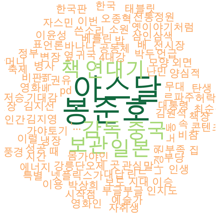
문화 분야 타이틀 단어 워드클라우드 | 경향, 오마이, 한겨레 사이트 첫 페이지에 걸린 문화 분야 뉴스의 워드 클라우드.