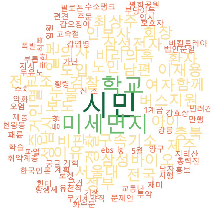
사회 분야 타이틀 단어 워드클라우드 | 경향, 오마이, 한겨레 사이트 첫 페이지에 걸린 사회 분야 뉴스의 워드 클라우드.