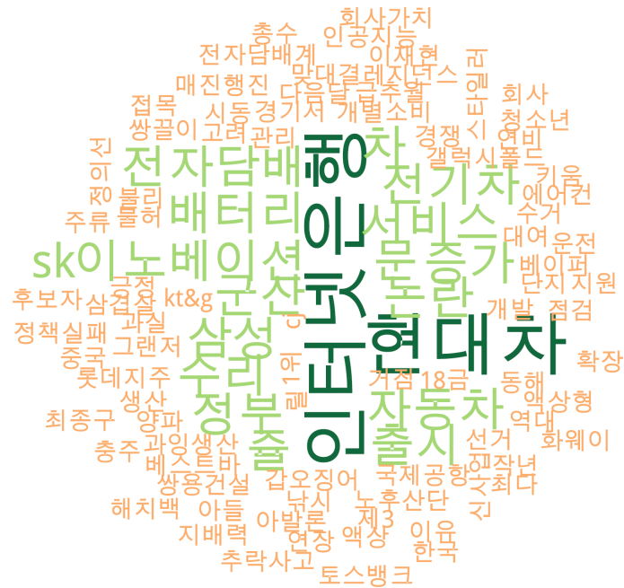
경제 분야 타이틀 단어 워드클라우드 | 경향, 오마이, 한겨레 사이트 첫 페이지에 걸린 경제 분야 뉴스의 워드 클라우드.

〈인터넷은행〉 등 정부에서 역점을 두고 있는 혁신경제와 관련된 이슈를 많이 다뤄준 편입니다.