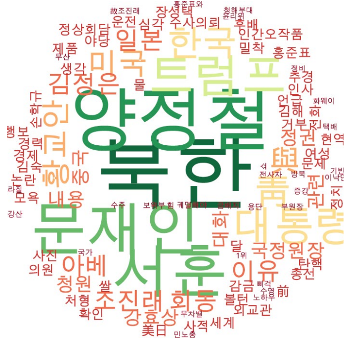
정치 분야 타이틀 단어 워드클라우드 | 동아, 중앙, 조선 사이트 첫 페이지에 걸린 정치 분야 뉴스의 워드 클라우드.

미사일이나 썩 대는 <북한>, 이를 옹호하는 <문재인>의 정치보복과 비선실세 <양정철>. 기회가 되면 <탄핵>까지?