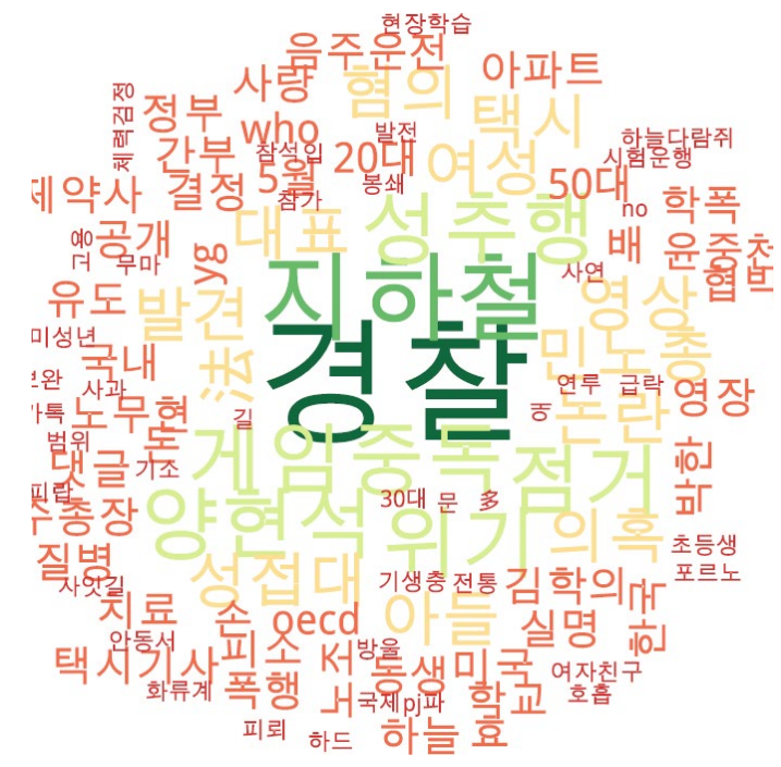
사회 분야 타이틀 단어 워드클라우드 | 동아, 중앙, 조선 사이트 첫 페이지에 걸린 사회 분야 뉴스의 워드 클라우드.