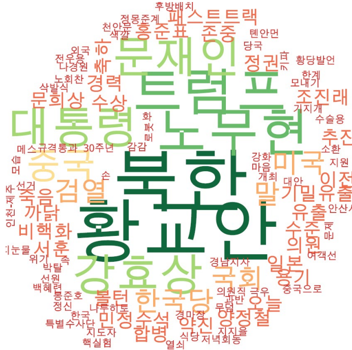
정치 분야 타이틀 단어 워드클라우드 | 경향, 오마이, 한겨레 사이트 첫 페이지에 걸린 정치 분야 뉴스의 워드클라우드.