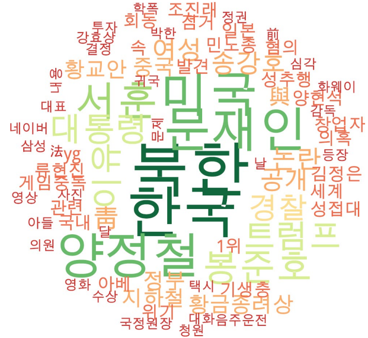
타이틀 단어 워드클라우드 | 동아, 조선, 중앙 사이트 첫 페이지에 걸린 뉴스의 워드 클라우드.