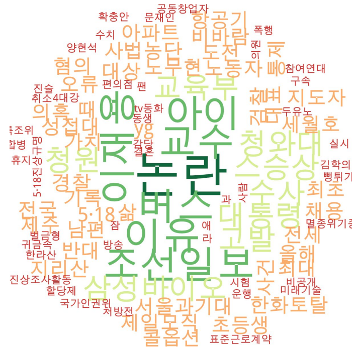
사회 분야 타이틀 단어 워드클라우드 | 경향, 오마이, 한겨레 사이트 첫 페이지에 걸린 사회 분야 뉴스의 워드 클라우드.

관련기사(※클릭하면 해당 언론사로 연결됩니다.) 경향 '공판이 호박즙' 논란 임블리, 식품위생법 위반 등 검찰 고발 당해 '대학판 숙명여고 사건' 서울과기대 교수 3명 기소...시험 자료 유출에 채용비리까지 [라이브리 댓글 테스트를 위한 기사]5살 아이가 TV동화 작가가 될 수 있다고? [속보]경찰, "버닝썬 수사 때 'YG 클럽 성접대 의혹' 관련 진술은 없었다" "문 대통령 탄핵" 청원 20만 돌파... '정치 싸움장' 된 국민청원 게시판 "인스턴트 끊은 뒤 아이가 생겼어요" 안동 초등생 태우고 현장학습가던 전세버스 3중추돌 참여연대 "오류 있는 보고서 합병에 사용해 이재용 최대 3.6조원 부당 이득" 청와대 청원 시작된 '5·18진상규명'... "정부, 미 비밀문건 확보해야" 오마이 '1+1' 팔아도 편의점은 손해 안 보는 이유 교육부 "조선일보가 주는 '스승상', 승진가산점 수정할 것" 녹음파일 속 '최수실 대통령'의 실체, 참담하다 버스 대란? 부르먼 언제나 달려오는 '천사 버스'가 있다 조계종 명예 산양삼 재배했더니... '출입 통제' 논란 창단 5개월만 우승 돌풍... "아구단 아이들도 살 균형 갖춰야죠" 청와대 "세월호 독립적 수사 말할 단계 아냐"... "무책임" 한센병 환자 대상 실험 고발... 엄마의 생생한 기록들