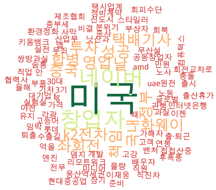
경제 분야 타이틀 단어 워드클라우드 | 동아, 중앙, 조선 사이트 첫 페이지에 걸린 경제 분야 뉴스의 워드 클라우드.

<미국> 경제에 대한 여전한 사랑(?)이 엿보이고, 정부와 각을 세워주고 있는 <이재웅>에 대한 관심도 지속되고 있습니다.