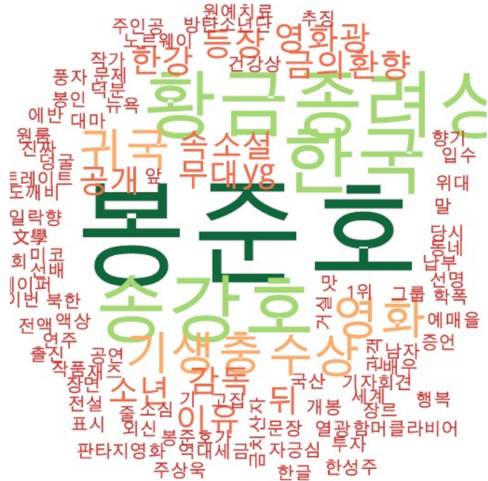
문화 분야 타이틀 단어 워드클라우드 | 동아, 중앙, 조선 사이트 첫 페이지에 걸린 문화 분야 뉴스의 워드 클라우드.