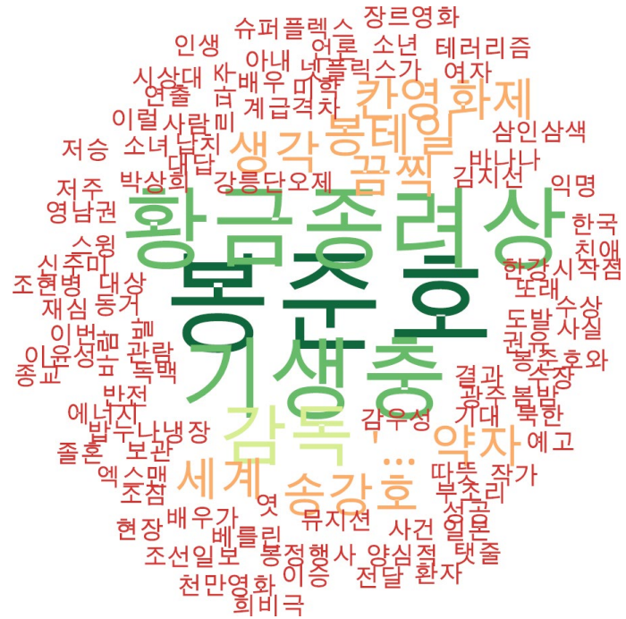
문화 분야 타이틀 단어 워드클라우드 | 경향, 오마이, 한겨레 사이트 첫 페이지에 걸린 문화 분야 뉴스의 워드 클라우드.