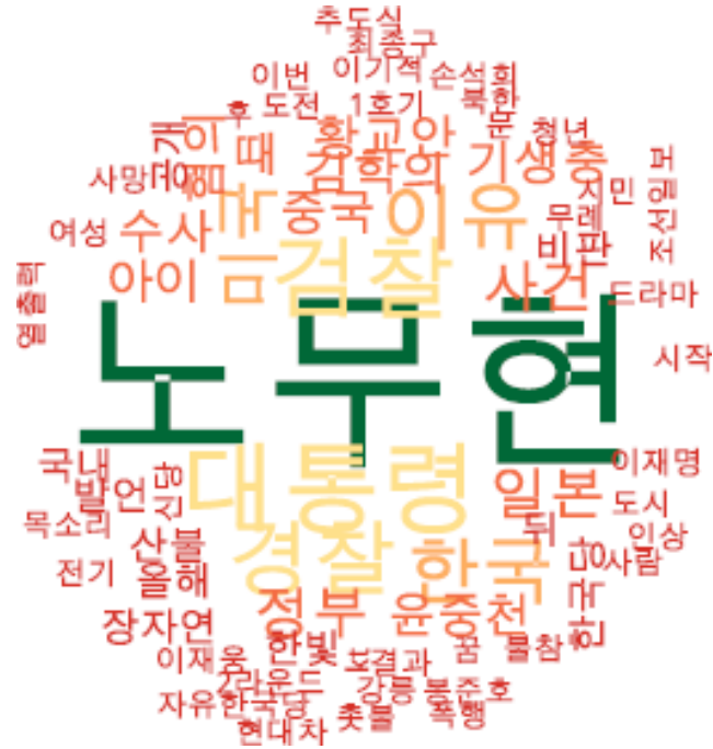
타이틀 단어 워드클라우드 | 경향, 오마이, 한겨레 사이트 첫 페이지에 걸린 뉴스의 워드 클라우드.

경향, 오마이, 한겨레의 첫 페이지에는 <노무현> 전 대통령에 대한 추모로 가득한 듯 보입니다. 반면에 정치적으로 대척점에 있던 동아, 조선, 중앙에서는 <미국>에 비해서도 비중이 작고, 보수의 유망주인 <황교안> 대표가 대신하고 있습니다.