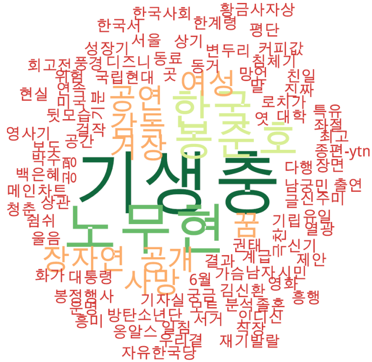
문화 분야 타이틀 단어 워드클라우드 | 경향, 오마이, 한겨레 사이트 첫 페이지에 걸린 문화 분야 뉴스의 워드 클라우드.