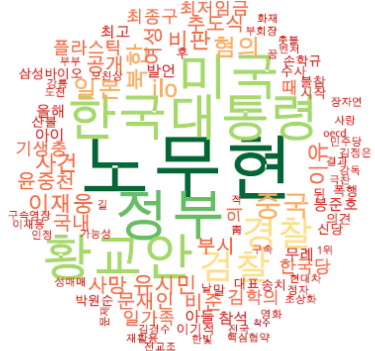
타이틀 단어 워드클라우드 | 경향, 동아, 오마이, 조선, 중앙, 한겨레 사이트 첫 페이지에 걸린 뉴스의 워드 클라우드. (※ 지속적으로 모니터링 대상 언론사를 추가할 예정입니다.)