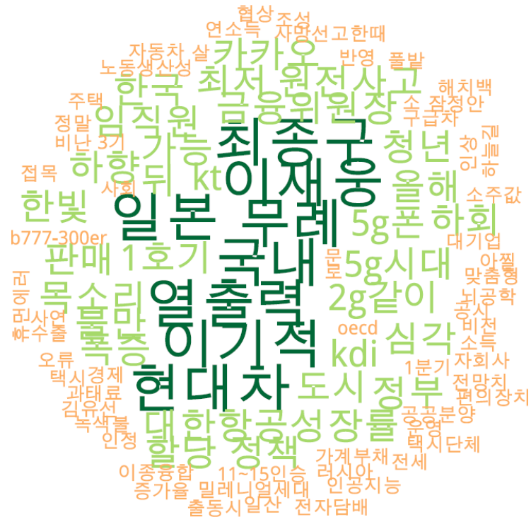
경제 분야 타이틀 단어 워드클라우드 | 경향, 오마이, 한겨레 사이트 첫 페이지에 걸린 경제 분야 뉴스의 워드 클라우드.