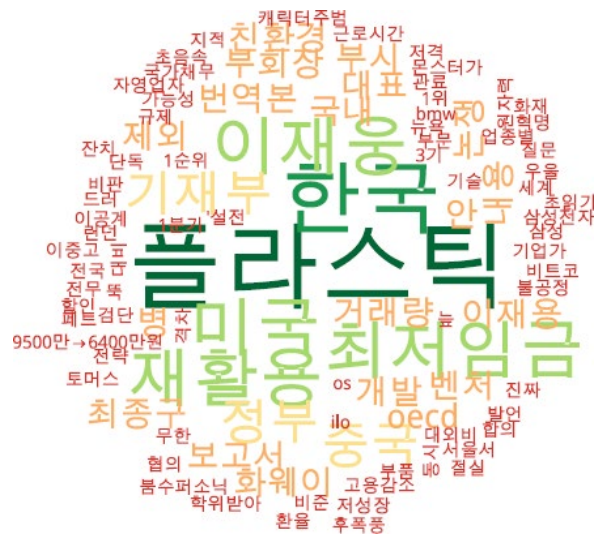
경제 분야 타이틀 단어 워드클라우드 | 동아, 중앙, 조선 사이트 첫 페이지에 걸린 경제 분야 뉴스의 워드 클라우드.

조선이 <플라스틱>에 관한 기사를 많이 실었습니다. <이재웅>과 정부의 대결구도를 즐기는 듯합니다. <최저임금> 때문에 경제 망가진다고 아우성인데, 더 심각한 임대료 등 불로소득으로 사라지는 막대한 국부에는 여전히 관심이 없습니다.