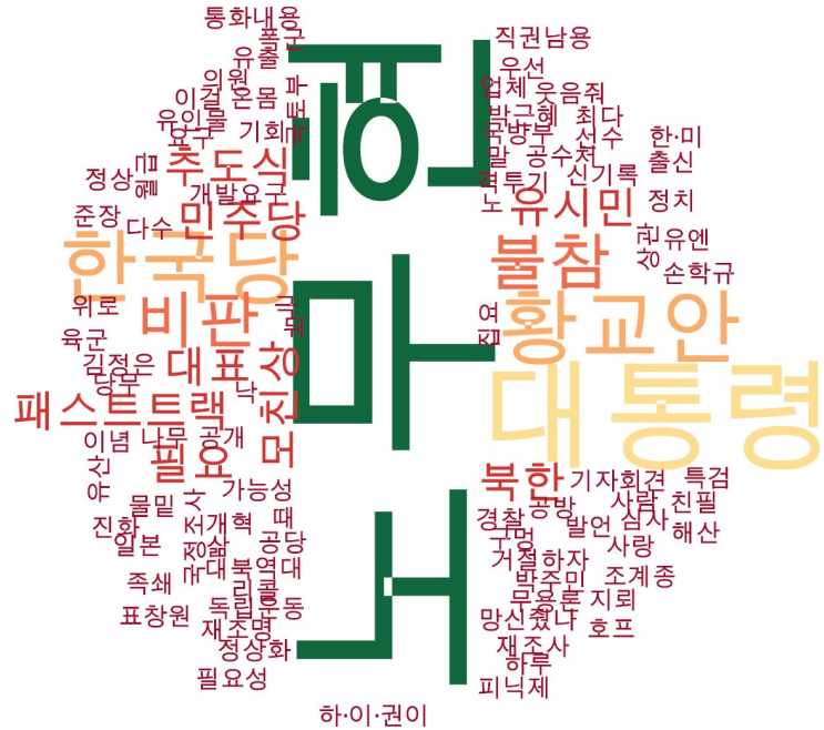
정치 분야 타이틀 단어 워드클라우드 | 경향, 오마이, 한겨레 사이트 첫 페이지에 걸린 정치 분야 뉴스의 워드 클라우드.