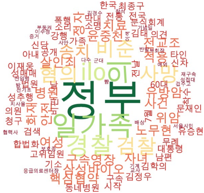
사회 분야 타이틀 단어 워드클라우드 | 동아, 중앙, 조선 사이트 첫 페이지에 걸린 사회 분야 뉴스의 워드 클라우드.