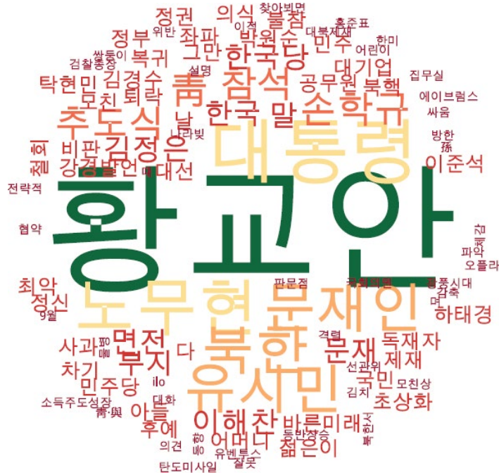
정치 분야 타이틀 단어 워드클라우드 | 동아, 중앙, 조선 사이트 첫 페이지에 걸린 정치 분야 뉴스의 워드 클라우드.