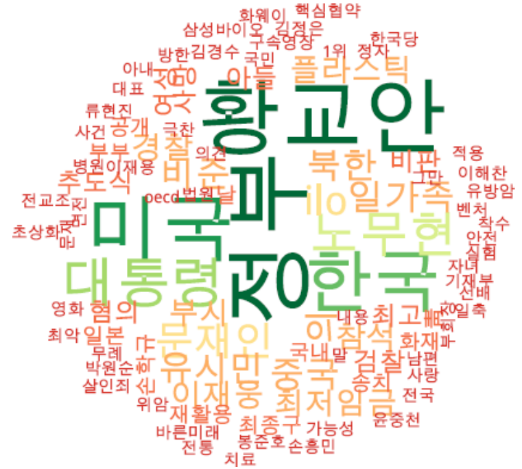
타이틀 단어 워드클라우드 | 동아, 조선, 중앙 사이트 첫 페이지에 걸린 뉴스의 워드 클라우드.