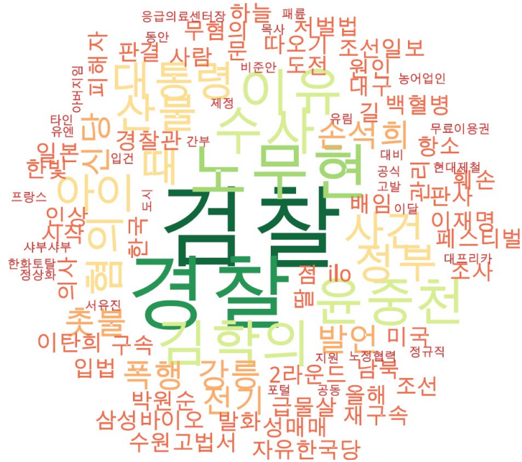
사회 분야 타이틀 단어 워드클라우드 | 경향, 오마이, 한겨레 사이트 첫 페이지에 걸린 사회 분야 뉴스의 워드 클라우드.

법을 만들어야 할 의원이 사법을 구하는 해괴한 정치가 지속되고, 9년의 국정농단과 적폐도 해결해야 하는 <검찰>과 <경찰>은 오늘도 바쁜가 봅니다.