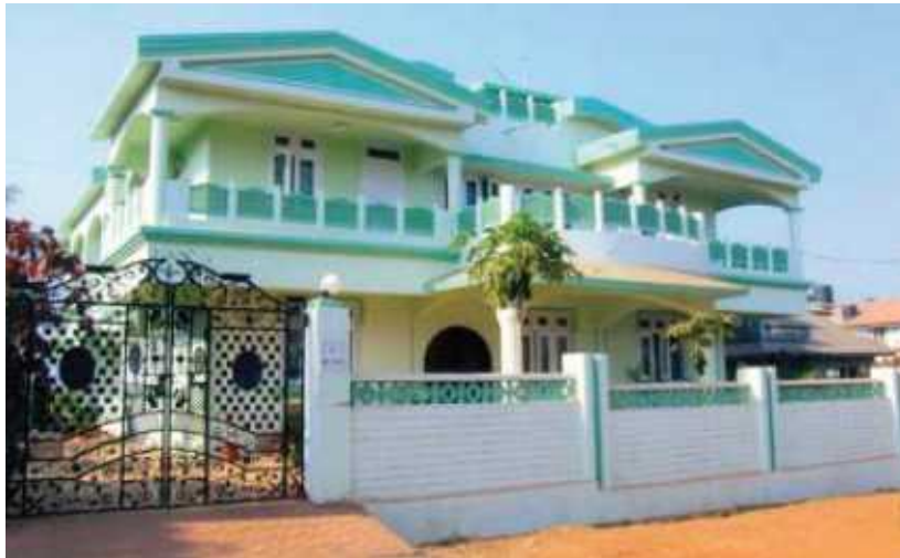
고아 주에 위치한 협동조합주택

최대 규모의 주택협동조합은 마하라슈트라 주 간디 사가르(Gandhi Sagar)에 위치한 '비다르바 프리미어(Vidarbha Premier) 주택협동조합' 이다. 이 협동조합은 1930년에 12인의 조합원으로 결성되었는데, 현재는(2011년 3월 기준) 그 조합원이 4만명에 이를 정도로 성장하였다. 그리고 이 조합은 재정적으로 완전히 자립한 상태이다. 여러 주 단위 지역연맹은 농촌 지역 주택협동조합 사업에 재정적 지원을 함으로써 저소득계층에게 혜택을 주고 있다. 이처럼 주택협동조합 사업은 농촌지역의 주택문제에도 관심을 갖고 접근하고 있다.