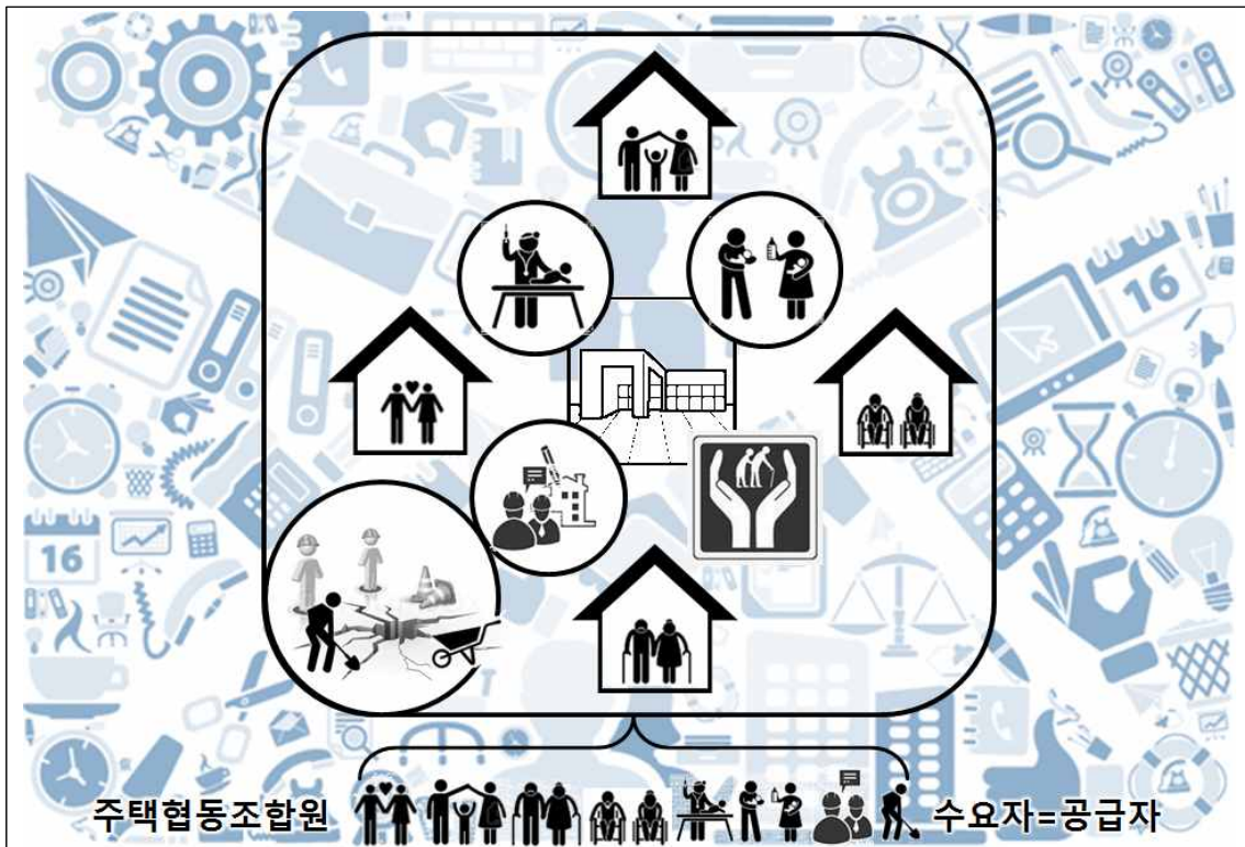
그림 3. 공동체주택(협동조합주택) 기반 사회적 경제마을

자료 : 서울특별시 사회적경제센터(2014), 서울시 사회적경제 발전 5개년 계획